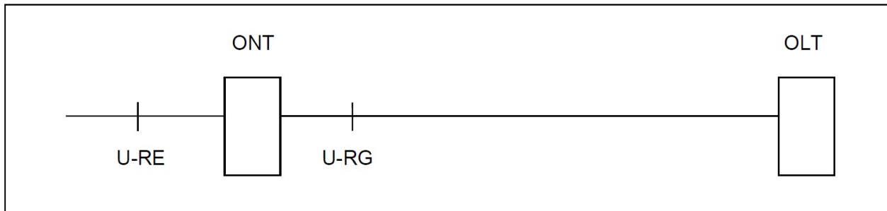
Abbildung Schematische Darstellung eines GPON (FTTH) Anschluss